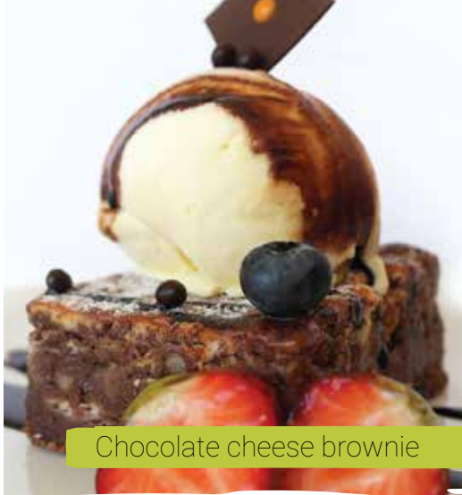
Chocolate cheese brownie