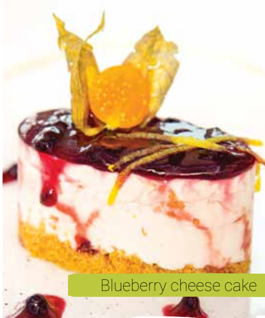
Blueberry cheese cake