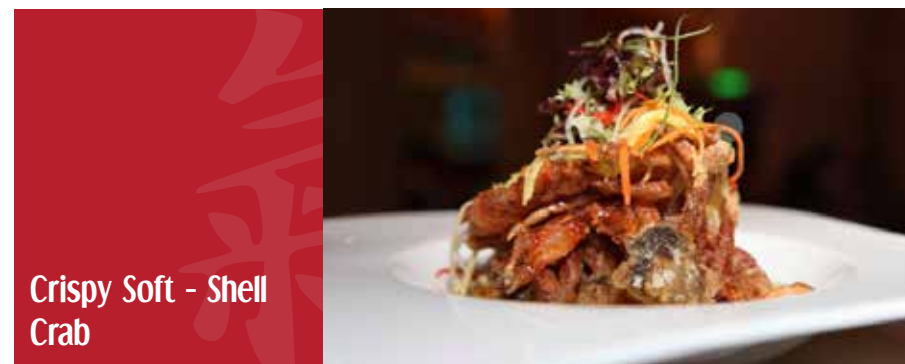
Crispy Soft - Shell Crab