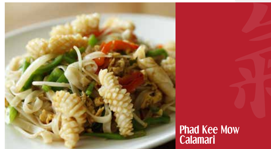
Phad Kee Mow Calamari