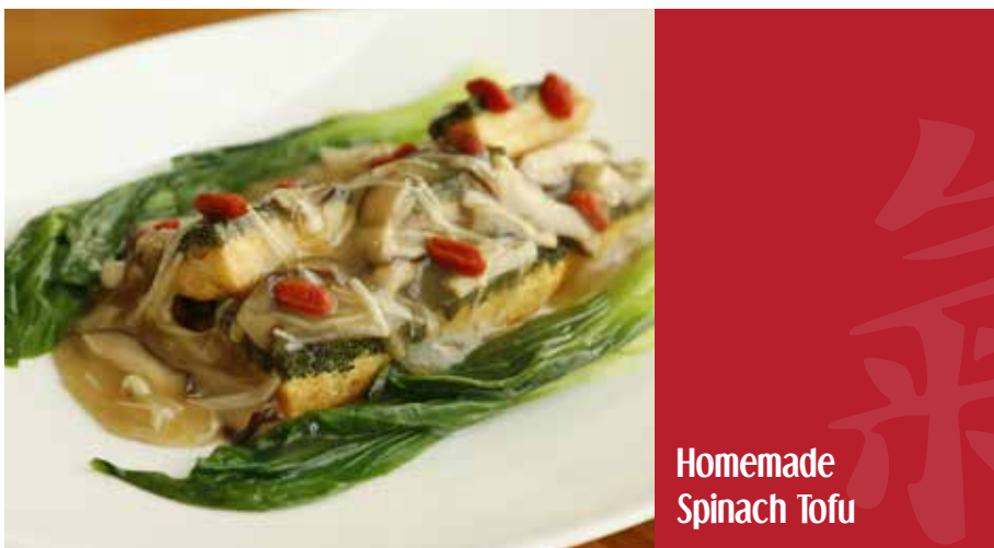
Homemade Spinach Tofu

Τηγανισμένα σε wok με λευκό λάδι τρούφας