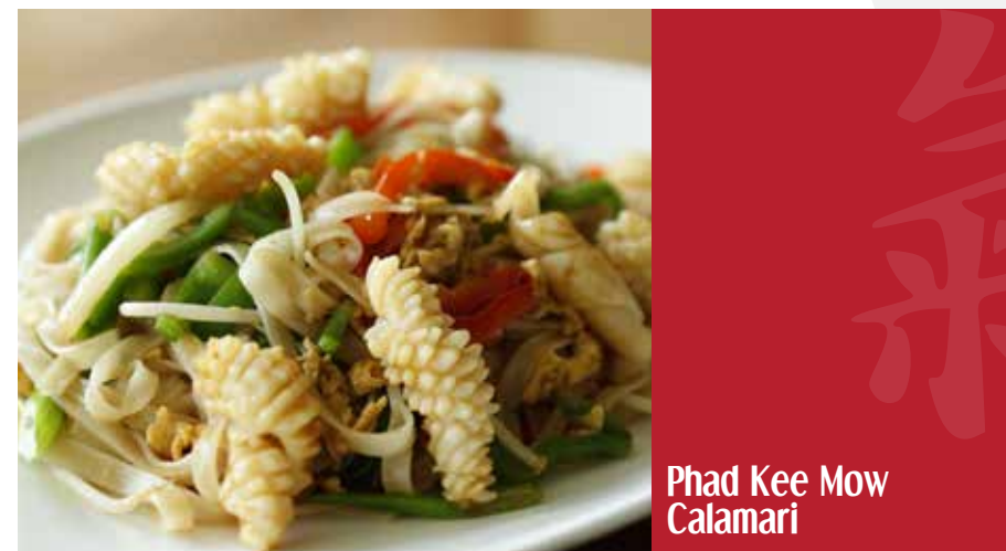
Phad Kee Mow Calamari