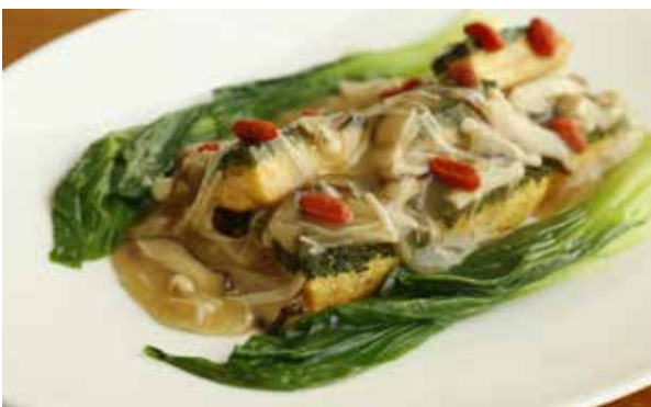
Homemade Spinach Tofu

4 Вида Грибов обжарены на сковороде вок с маслом из белых трюфелей