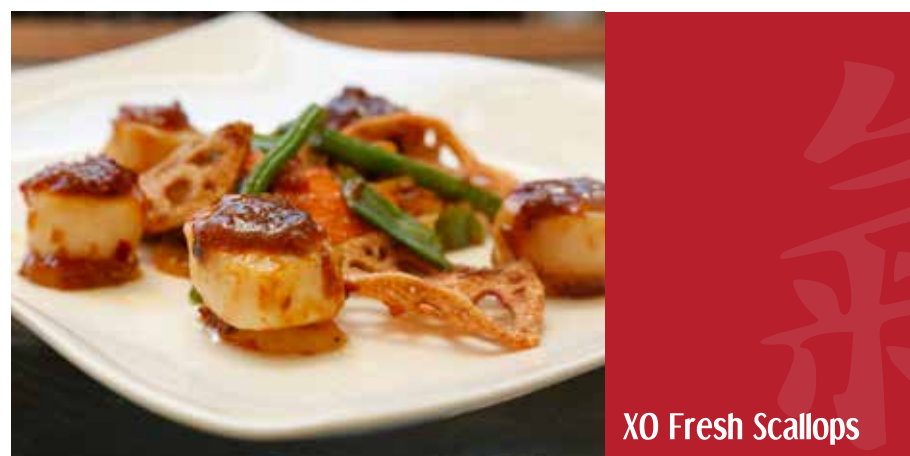
XO Fresh Scallops

Креветки обжаренные на сковороде вок с водяным каштаном и чесноком, в сингапурском соусе чили с зелёным луком. Подаются с китайской булочкой