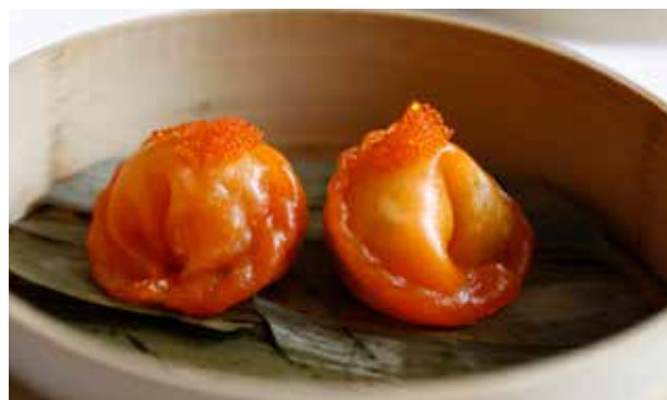
Enoki and Prawn

Φασολάκι και καρότο σε ζύμη αρωματισμένη με γλυκό τσαϊ και ελιά. Με tobiko. Συνοδεύεται με σάλτσα τσίλι