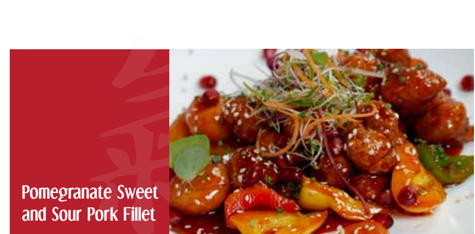
Pomegranate Sweet and Sour Pork Fillet

Говяжья вырезка, приготовленная с шампиньонами, устричными грибами и шиитакэ, корнем лотоса, спаржей, имбирем, чесноком и мороми мисо