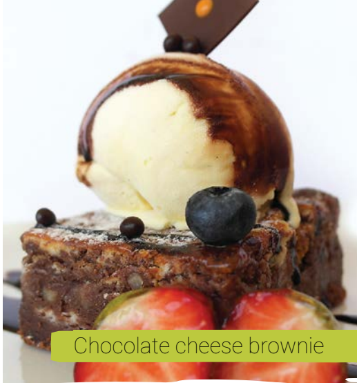
Chocolate cheese brownie