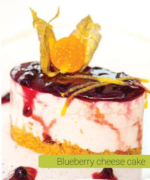
Blueberry cheese cake